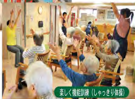
楽しく機能訓練(しゃっきり体操)