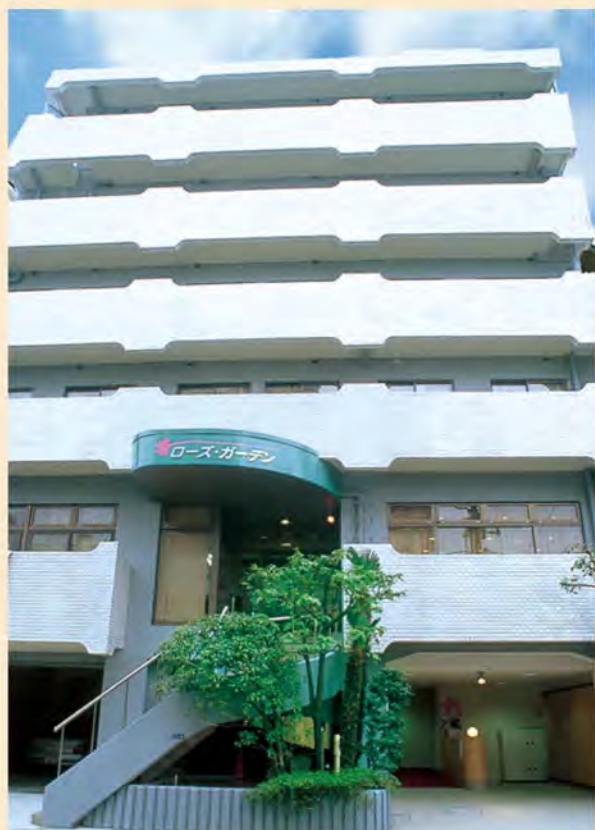
土地・建物権利形態：賃借