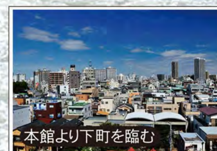
本館より下町を臨む