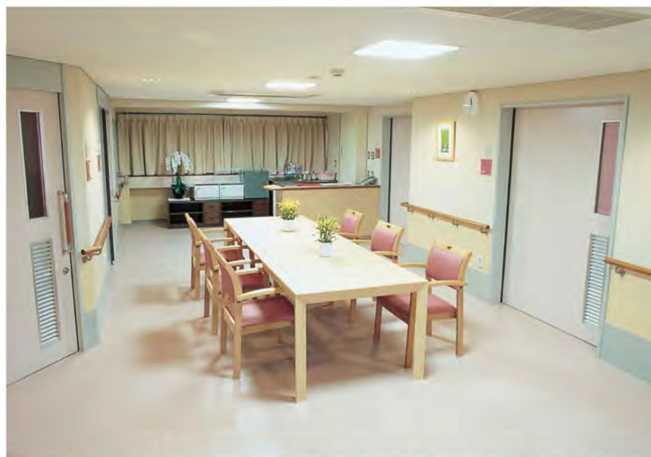
各階フロア（食堂と共用します。上記は5階フロア）