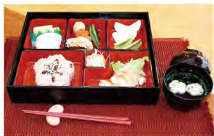
お食事も楽しみのひとつです。

私共はご入居者の方々が、その人らしく快適に、明るく、楽しく、安全に過ごし頂けるようサポートしていくことを使命と考え、生活支援から始まり以下のようなサービスをトータル的にご提供致します。