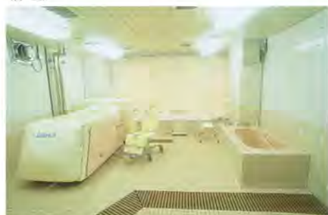
入浴者に安心感を与える対面式のバスです。