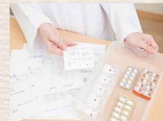
協力薬局：かばさん薬局