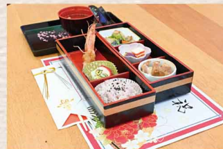
食事サービス ※(写真は特別食)