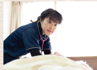
健康管理サービス