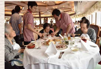
アクティビティサービス