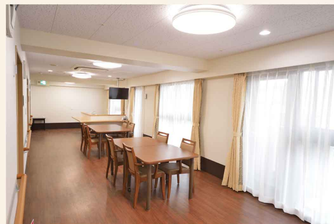
5F開放感と落ち着くロケーションの食堂兼機能訓練室