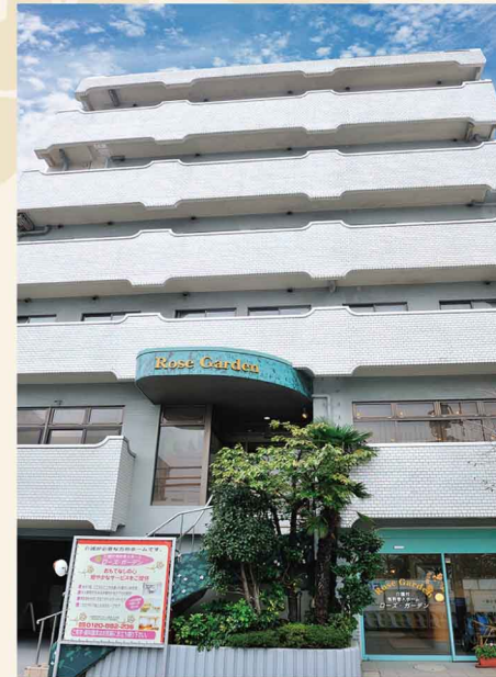
ローズガーデン本館(平成13年設立) 土地建物の権利関係: 賃借(有)加藤商店

ローズ・ガーデン同様、小規模ホームを計画させて頂いており、これまで大事にしてきた、お客様に暖かく、親身できめ細かい、お世話をさせて頂くことを目標としております。粋な深川の地に南側を仙台堀川、西に名勝清澄庭園と豊かな環境、交通の便にも恵まれております。急速に進む高齢化社会の中、深川地区の拠点として質の高いお世話を目指し、お客様、ご家族、地域の方々の御意向に沿える様、邁進して存じます。