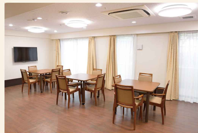
外光を多く取り入れた集会室(1F)