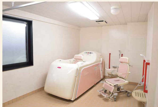
安全にご入浴頂ける対面式介護浴槽