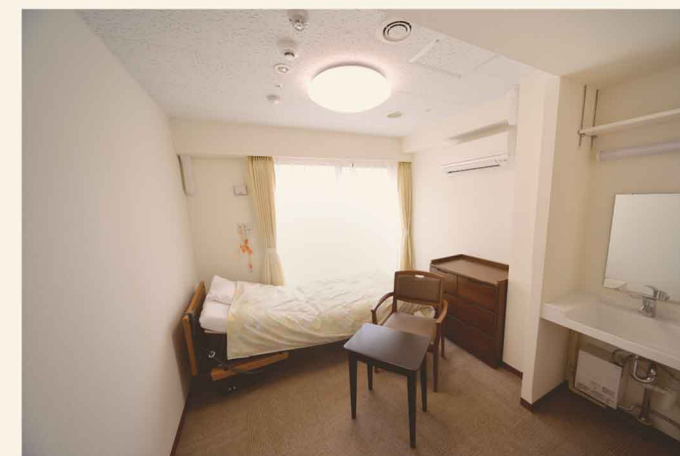
プライベートを保ちつつ自立した生活ができる居室(13.5㎡・15.9㎡)